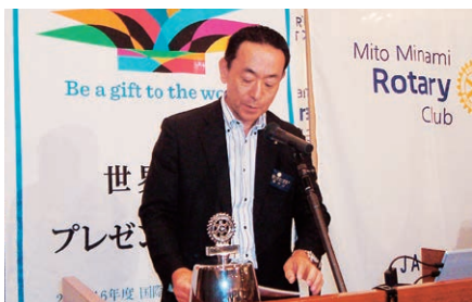
高橋国際奉仕委員長による「地区国際奉仕研究会報告」

日時：8月28日(金) 12:30開始 場所：水戸プラザホテル ※例会開始時間が12時30分になります。お間違えないようご注意ください。