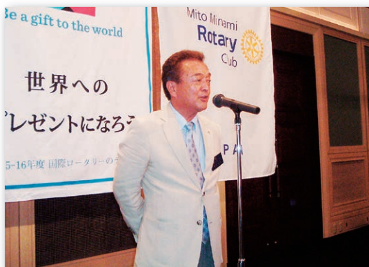
根本会長による懇親会開会挨拶