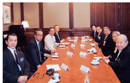
クラブ協議会に先立ち、役員協議会が行われました。