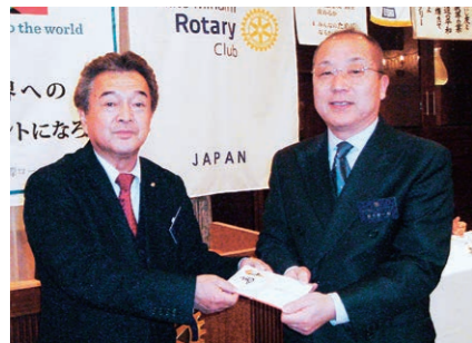
根本会長から長女が結婚された郡司会員にお祝いが手渡されました。