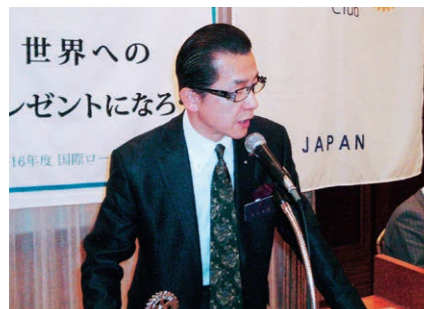
米田副幹事による初めての幹事報告