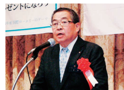
大金第3分区ガバナー補佐の挨拶