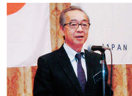
綿引会長エレクトによる開宴の言葉