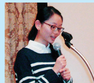
ウ ベイシュンさん(台湾)の発表