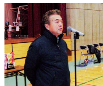
根本会長による主催者挨拶