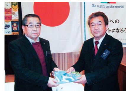
水戸ホーリーホック推進協議会副会長の大金会員から根本会長に水戸ホーリーホックの今年のノボリが手渡されました。