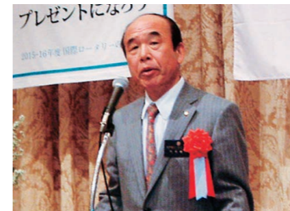
市毛IM実行委員長による開会の言葉