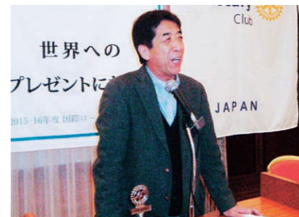
IMリハーサルについて説明する一毛IM実行副委員長