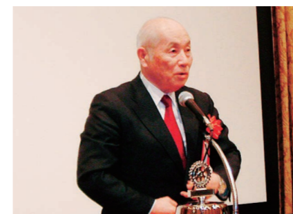
吉岡第3分区IMリーダーの所感