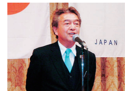
根本会長による歓迎の挨拶