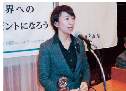
ロータリーの時間:川澄会員より例会時の服装について大変有意義な話がありました。