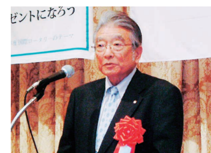
倉沢R1第2820地区ガバナーの挨拶