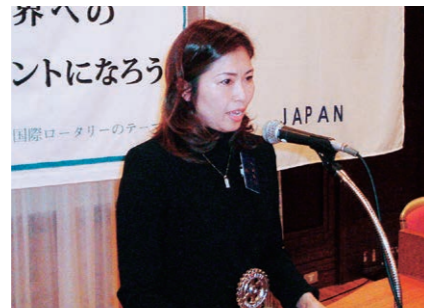
川崎雑誌委員長より「ロータリーの友」の記事紹介がありました。