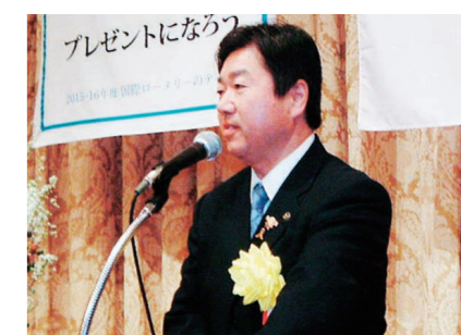
水戸市長高橋靖様による来賓挨拶