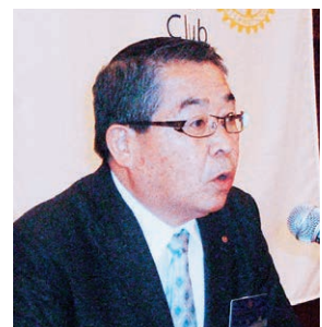
大金第3分区ガバナー補佐より、IM時の協力に対して御礼がありました。