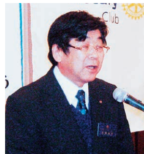
高柳ニコニコBOX委員長「ニコニコへの献金、よろしくお願いします。」