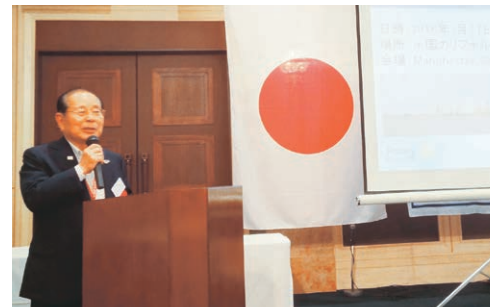
白戸ガバナー記念講演