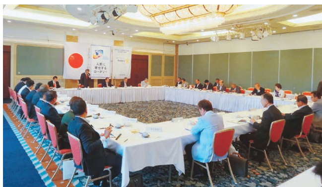
クラブ協議会の様子