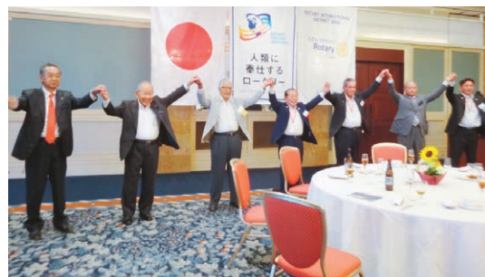
白戸ガバナーと水戸南ロータリアンによるひとつの輪が出来ました。