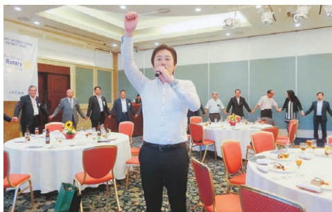
ソングリーダー桑名会員による「手に手つないで」