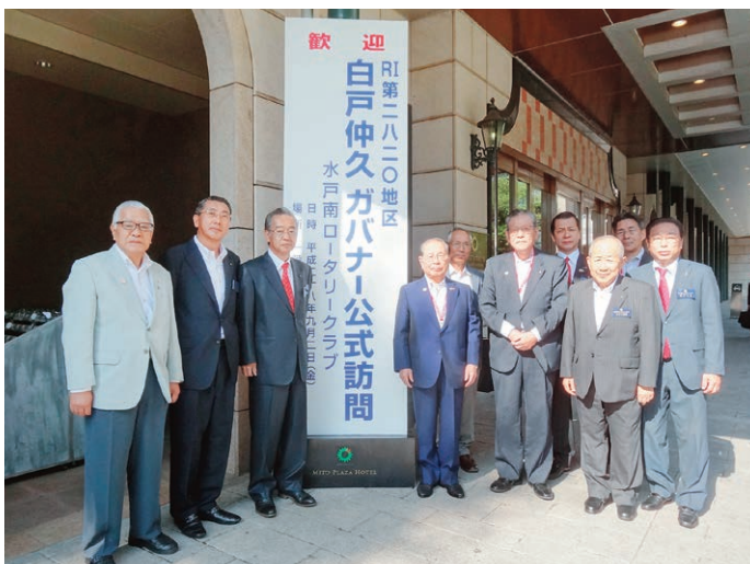
ホテル玄関前で、白戸ガバナーをお迎えです。

日時：9月16日(金) 12:30～ 場所：水戸プラザホテル 内容：9月誕生祝い 研究会報告 (職業奉仕・ロータリー財団・社会奉仕・国際奉仕)