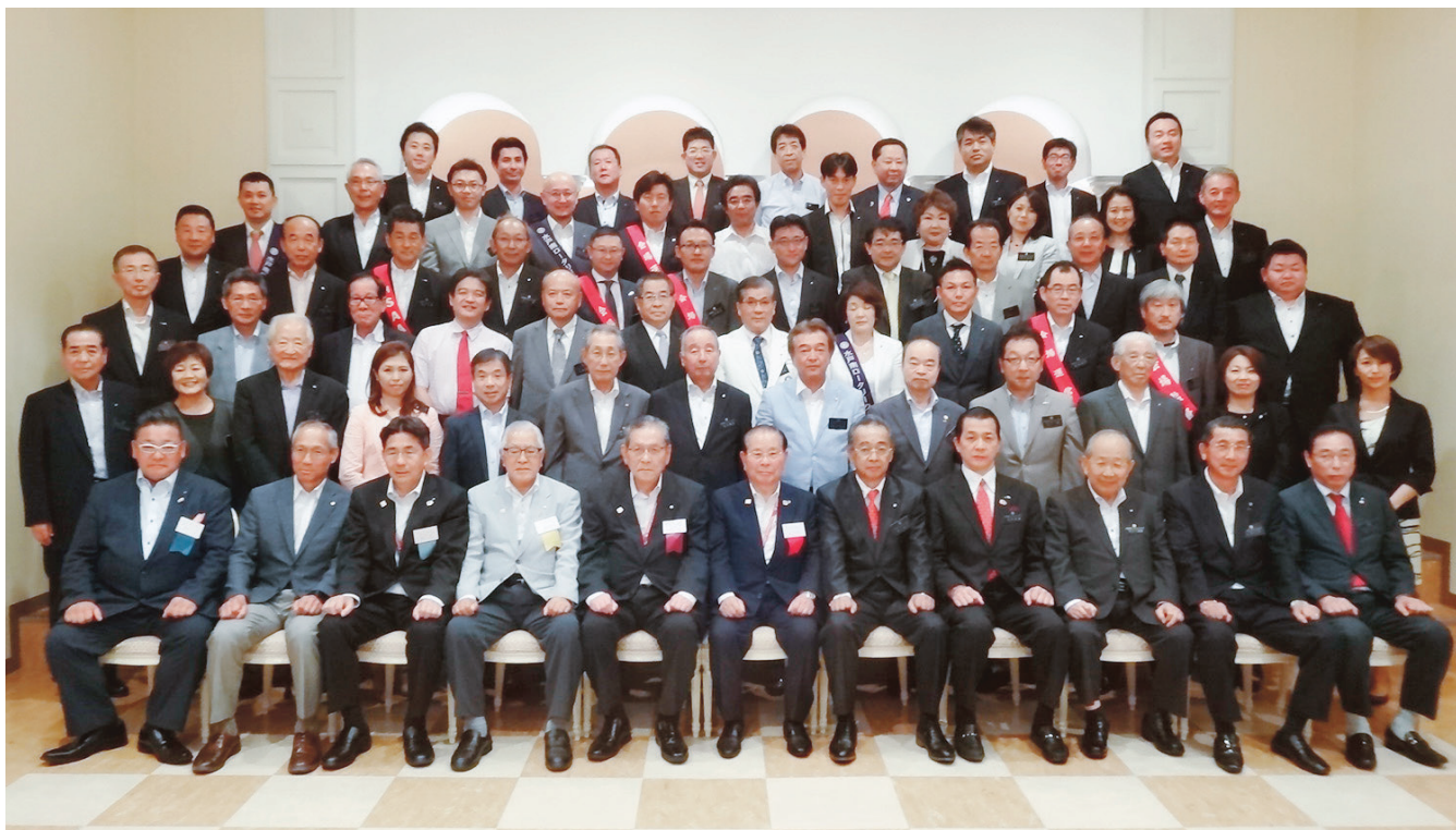
白戸ガバナーと記念撮影