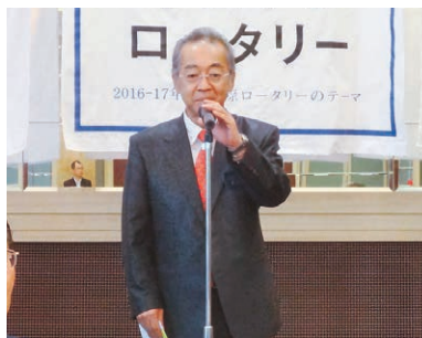
綿引会長による懇親会の開会挨拶