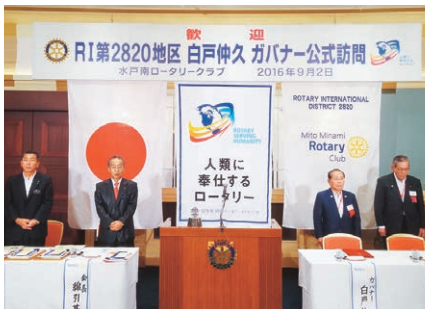
例会でロータリーソング斉唱