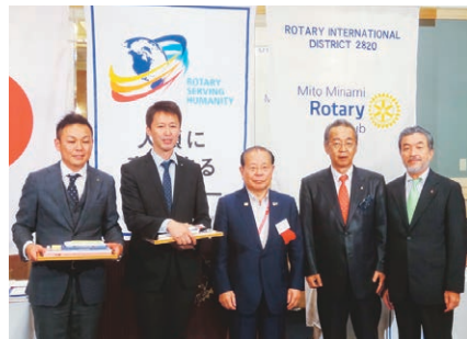
3名の新会員入会式