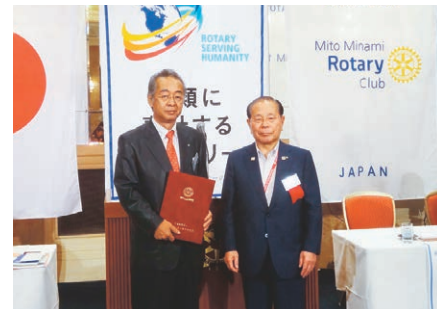
RIから財団献金の表彰