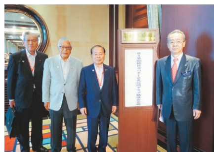
クラブ協議会会場前