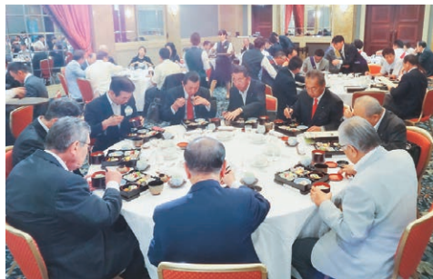
ガバナーを囲んでの昼食