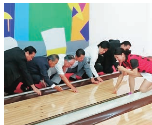
レーンのオイルをチェック