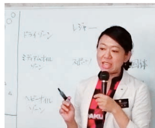
国本会員によるレクチャー