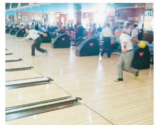
みんなで楽しくボウリング