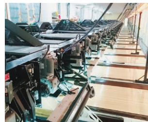
バックヤードの見学