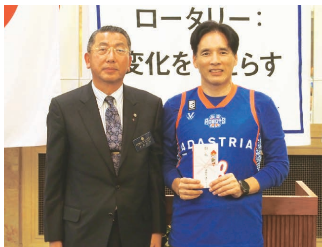
堀学長の水戸への熱い思いに感謝