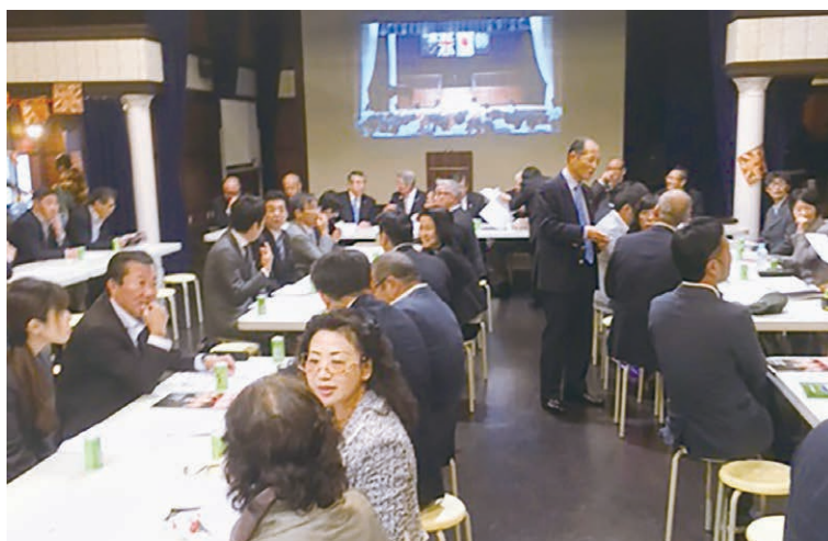
R1第2820地区内の仲間達と研鑽を積みました