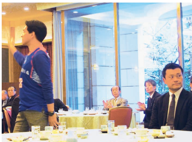
堀学長と茨城ロボツ山谷代表がお越し下さいました