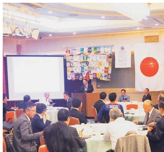
ロータリーの時間 石川国際奉仕委員長