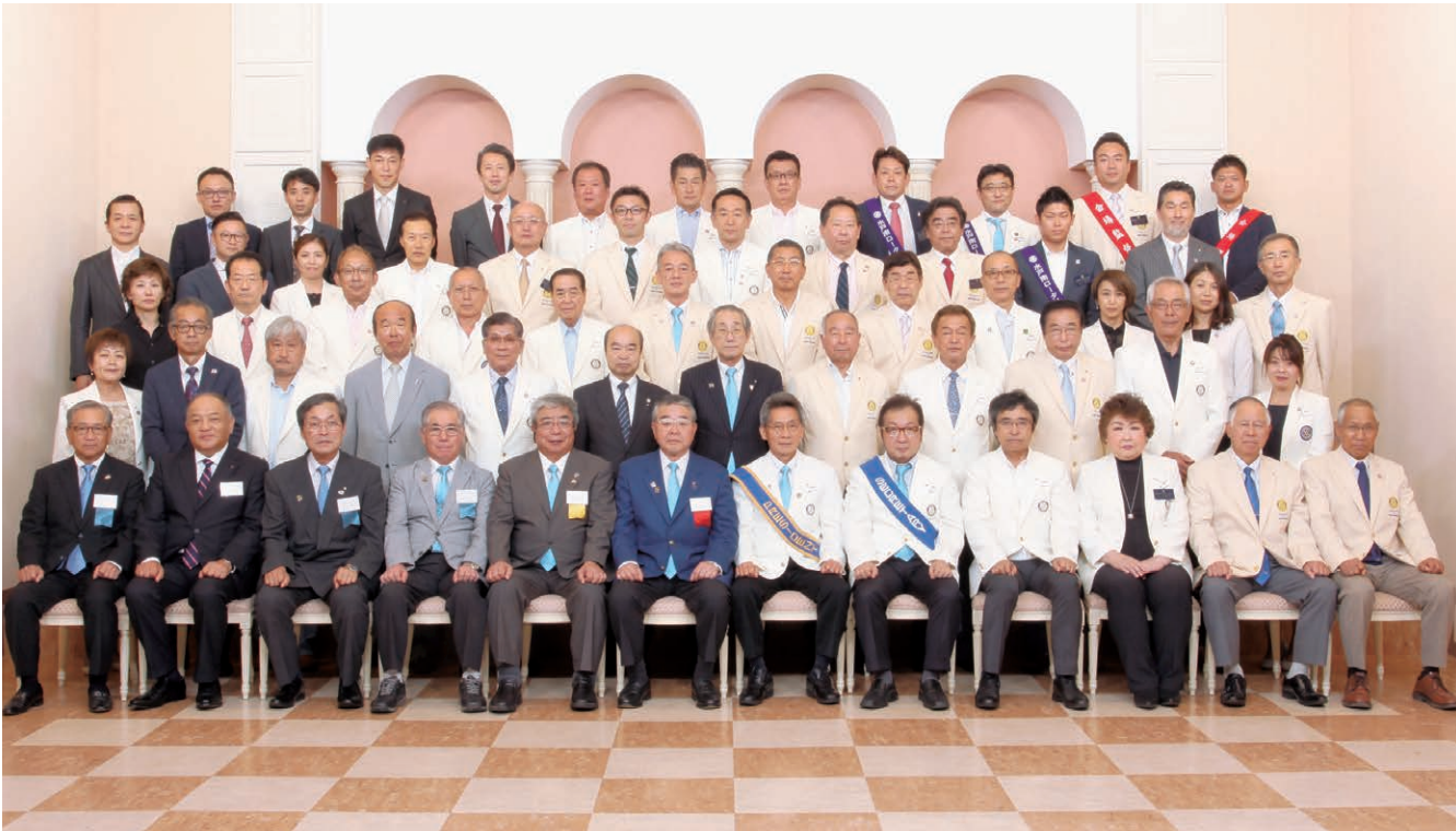
ガバナー公式訪問記念写真