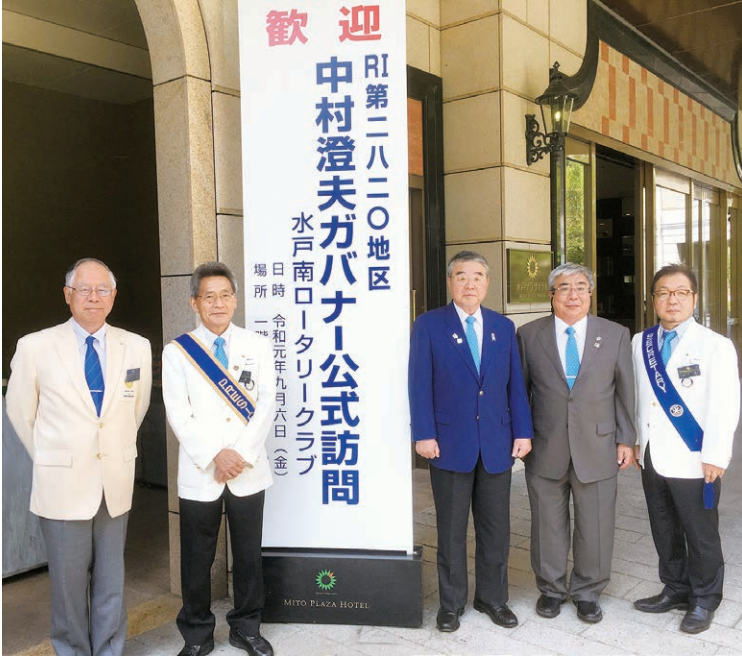
中村ガバナーお出迎え