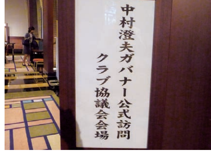
クラブ協議会会場入り口