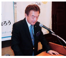
根本会長より次年度理事・役員が発表され、無事年次総会にて承認されました。