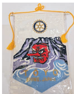
第2670地区東予RC(愛媛県)とバナー交換が行われました